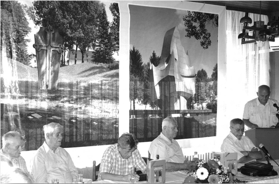
Радно Предсједништво Округлог стола