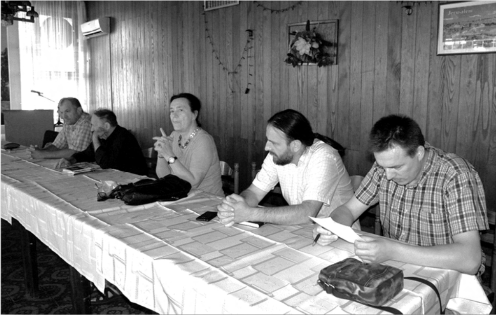
Књижевници и пјесници – редовни учесници округлих стола