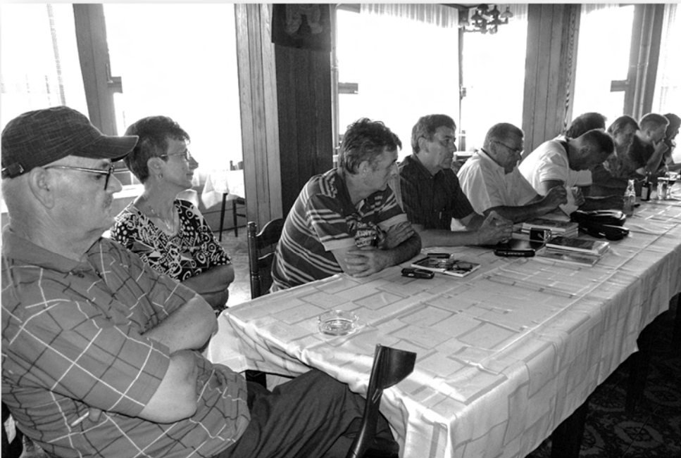
Излагање учесника Округлог стола праћено је са посебном пажњом ➤