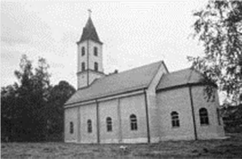
Католичка црква у Санском Мосту