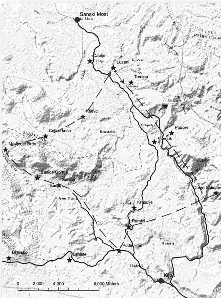
Избјеглички пут – јануар-фебруар 1943.