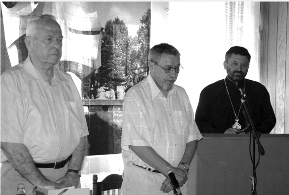
Одавање поште свим жртвама злочина на Шушњару